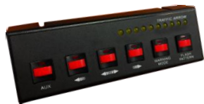
SW600 - 5 interrupteurs - 1 Bouton poussoir - 10 LED témoins