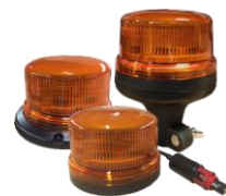
Gyrophares LED - Gamme 105 et 155