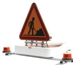
Pack E - Triangle relevage électrique - 2 gyrophares LED