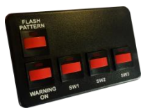
SW500 - 4 interrupteurs - 1 Bouton poussoir