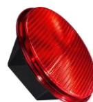
Kit à LEDs